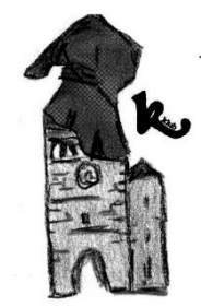
šifra č.6, heslo PAVLIŠOV